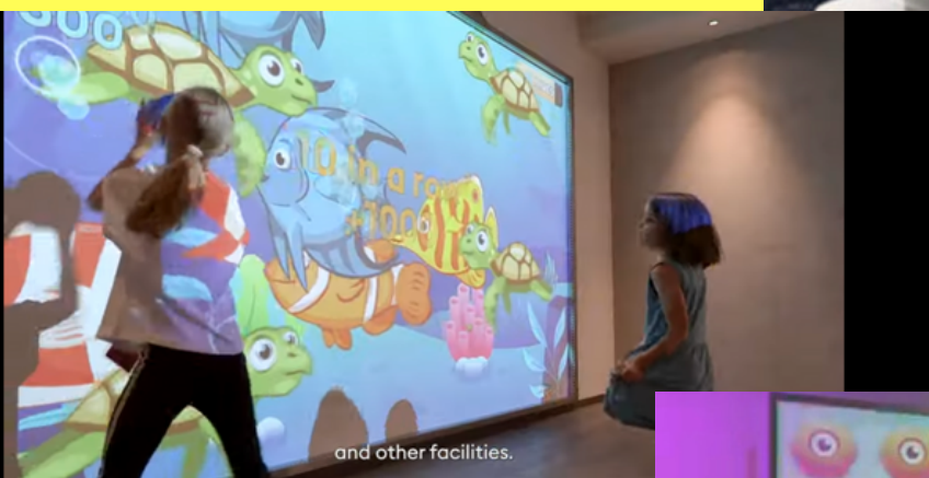
and other facilities.